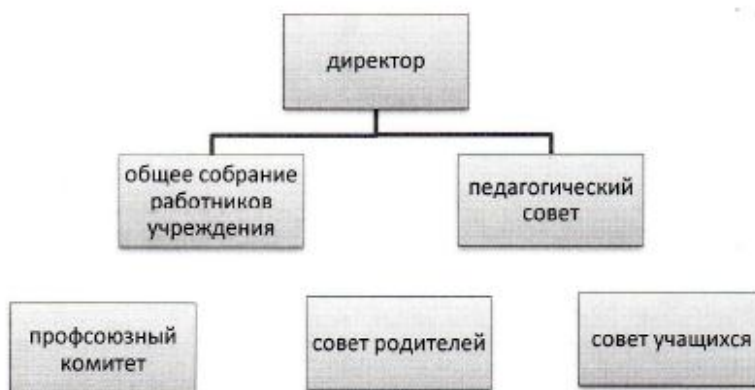
Структура управления МОУ «Поршурская СОШ»

Управление ОУ осуществляется на основе сочетания принципов единоначалия и коллегиальности.